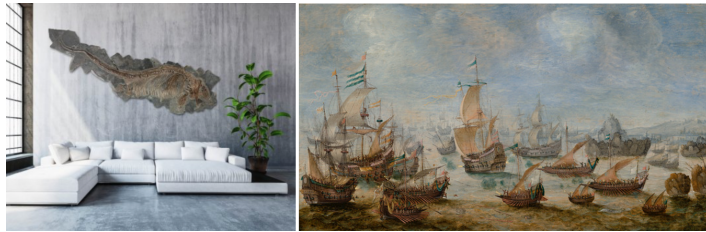
Links de 180 miljoen jaar oude ichtyosaurus van Stone Gallery, rechts een 17e eeuws schilderij van Pieter Savery van Kunsthandel P. de Boer