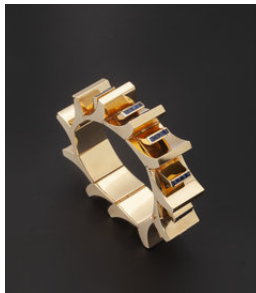
Cartier, ca. 1945 Marjan Sterk Fine Art Jewellery

Galerie m.simons maakt haar debuut op de PAN met een speciaal voor haar stand vervaardigde muurschildering van Jan van der Ploeg in de afmetingen 3 bij 3 meter. Van der Ploeg is met zijn muurschilderingen niet alleen op prominente plekken in de publieke ruimte maar ook in grote musea (waaronder Kunstmuseum Den Haag, Boijmans van Beuningen Rotterdam en Rijksmuseum Twenthe, Villa Mondriaan) vertegenwoordigd. Van de inmiddels meer dan 500 muurschilderingen die hij heeft vervaardigd zijn er vele bij verzamelaars thuis gemaakt.