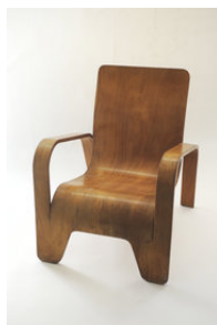
BOW chair Grete Jalk, 1963 Oplage: 200 stuks WonderWood