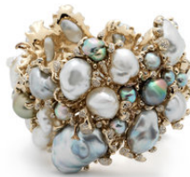
Bibi van der Velden

Chabot Fine Art levert een belangwekkende bijdrage aan PAN Amsterdam met een museaal werk van Christiaan Megert, een van de grondleggers van ZERO. Uit dit werk, dat rechtstreeks uit het atelier van de kunstenaar komt, blijkt hoe Megert de fragmentering van de voorstelling onderzoekt door een strikte ordening van rechthoekige, lichte kleurvakken los te laten.