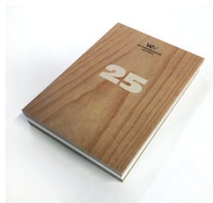
Jubileumuitgave WonderWood Twee edities