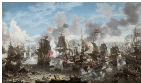
De slag bij Focchies, 1649 Bonaventura Peeters de oude (1614-1652) Olieverf op doek 78,7 x 130 cm Galerie Bijl-Van Urk