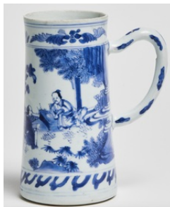
Een blauw-wit porseleinen kroes met handvat, zogenaamde "Snelle". China, Transitional Period (1635-1644), Hoogte: 18,5 cm | Diameter: 10 cm. Typisch voorbeeld van Chine de Commande of export porselein in opdracht van de V.O.C.