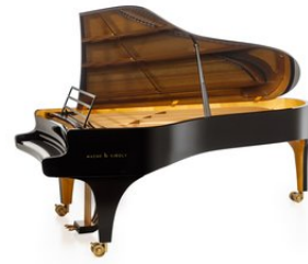
de Maene-Vinoly vleugel