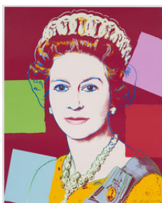
Andy Warhol Reigning Queens Elizabeth II van Engeland