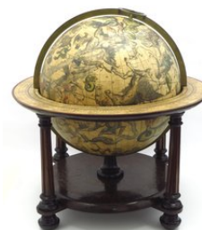
Valk hemelglobe, 1715