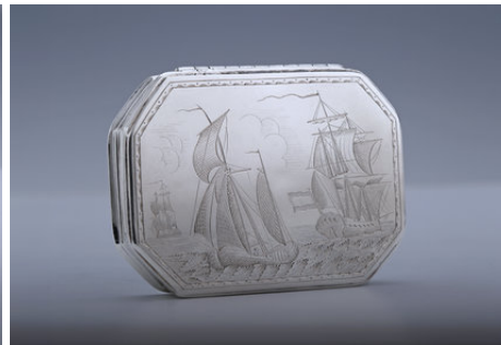
Tabaksdoos met schepjes, Amsterdam ca 1740 Hendrina Das