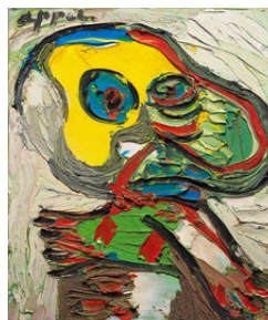
Karel Appel Personnage 1976 Oil-Canvas