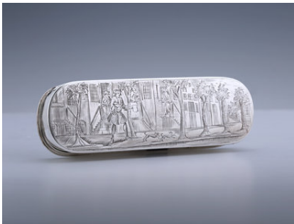
Tabaksdoos met grachtenscene, Amsterdam 1749 Leendert Beekhuysen Courtesy A. Aardewerk

Jubileumjaar Amsterdam 750 gaat op 27 oktober van start, mooie aanleiding om de stad in de spotlights te zetten. Op PAN Podium figureert Amsterdam 750 twee dagen lang als thema en kunstvoorwerpen van Amsterdamse herkomst verrijken menige presentatie. Zo brengt de Haagse antiquair, juwelier en zilver specialist A. Aardewerk een hommage aan Amsterdams glorieuze verleden met een stand die in het teken staat van 17 e en 18 e eeuws Amsterdams zilver. Op een uitvergroete kaart uit dezelfde periode (het origineel is op de PAN te koop bij Mefferdt & De Jonge) staat aangegeven waar de makers ervan hun atelier hadden. Onderdeel van de presentatie is een belangrijke particuliere collectie antieke zilveren tabaks- en snuifdozen; onder de ruim 40 dozen bevinden zich rijk gegraveerde en uiterst zeldzame exemplaren. Hiernaast is er voor liefhebbers van 17 e en 18 e eeuws Amsterdams zilver ook een monumentale wijnkan van Johannes Schiotling, het achtidelige Tuinhout servies van Frederik Manicus en een collectie zilveren miniaturen.