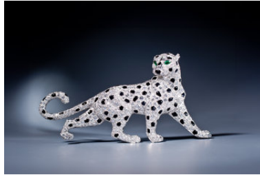
Panthère de Cartier broche