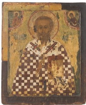
Heilige Nicolaas de Wonderdoener Rostov, eerste helft 16e eeuw Eitempera op gesso op met linnen bespannen hout 48,5 x 40 cm Collectie Heutink Ikonen

Op zondag 24 november vergezelde een groepje kinderen van de Amsterdamse organisatie NOORDJE (actief in kunst- en taalprojecten) de Sint bij zijn wandeling door de RAI. Vooral de Sint-Nicolaas portretten trokken ieders aandacht. Op de oudste icon, uit de eerste helft van de zestiende eeuw, is Nicolaas gekleed in het gewaad van een bisschop. Met zijn rechterhand maakt hij een zegenend gebaar en in zijn linkerhand houdt hij een evangelieboek vast. Graag had de Sint dit meesterwerk voor een bedrag van € 80.000,- aangeschaft, maar nee, bij nader inzien geeft hij liever zelf cadeaus. Voor ieder van de kinderen had hij dan ook een aanmerkelijk minder kostbaar maar ingelijst en gesigneerd portret van hemzelf bij zich.