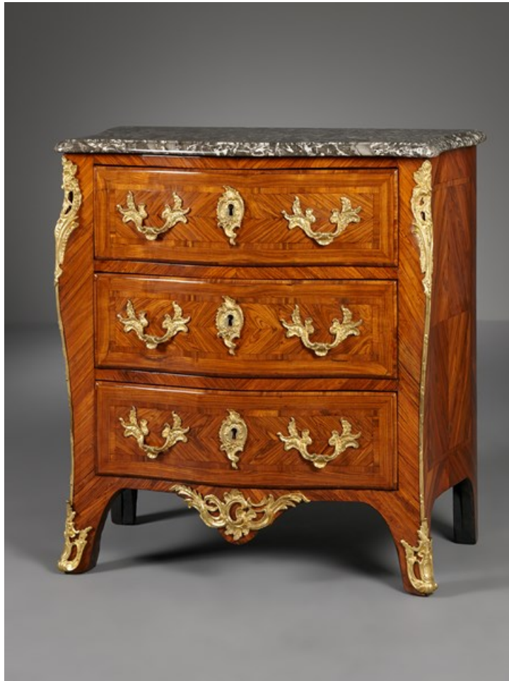
Kleine Franse Louis XV commode